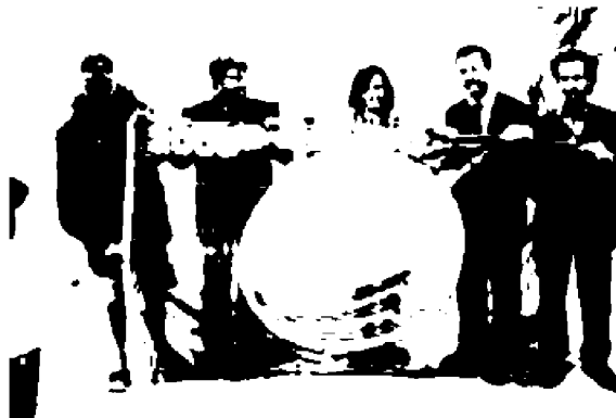
La consegna della bandiera blu alle autorità comunali