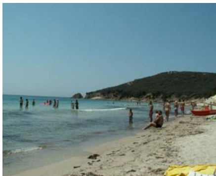
FOTO SPIAGGIA PORTO TRAMATZU

La spiaggia più vicina è quella di Porto Tramatzu a ca. 7 km. dall'agriturismo. Si può parcheggiare vicino ad una pedana in legno che porta all'entrata dello stabilimento balneare che risulta accessibile vedi sito http://www.noleggiogommoni.it/portotramatzu.htm . Non hanno in dotazione sedie da mare JOB o ausili che facilitano l'ingresso in acqua delle persone disabili. Spiaggia di sabbia fine con alcune dune che creano qualche difficoltà per accedere alla spiaggia libera che si trova sia a destra che a sinistra dello stabilimento. Non vengono forniti teli mare. Presente passerella in legno che arriva fino a 10 metri dal mare. Servizi igienici adeguati in prossimità della spiaggia. È presente l'assistente bagnanti.