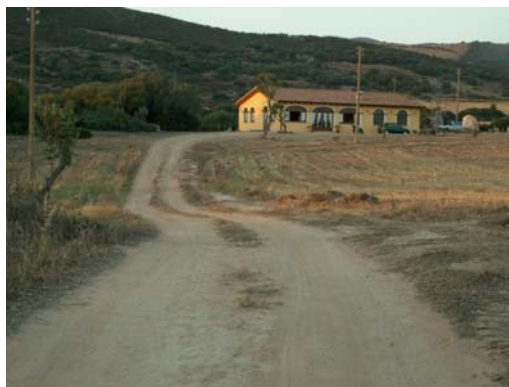
FOTO TRAGITTO CAMERA RISTORANTE

E' possibile riservare sempre lo stesso tavolo sia a persone disabili , non vedenti, ma anche a normodotati. Il tragitto dal ristorante alla camera è lungo ca. 200 metri ed è in terra battuta, ma a causa del vento ci sono alcuni tratti sabbiosi alternati a buche ed è consigliabile percorrerlo con accompagnatore. Di notte non è illuminato.