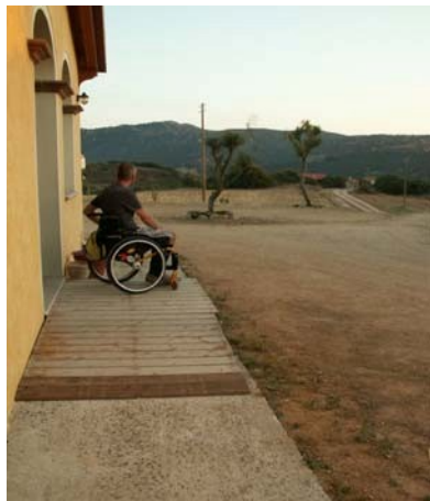
FOTO RAMPA RISTORANTE

E' possibile riservare sempre lo stesso tavolo sia a persone disabili , non vedenti, ma anche a normodotati. Il tragitto dal ristorante alla camera è lungo ca. 200 metri ed è in terra battuta, ma a causa del vento ci sono alcuni tratti sabbiosi alternati a buche ed è consigliabile percorrerlo con accompagnatore. Di notte non è illuminato.