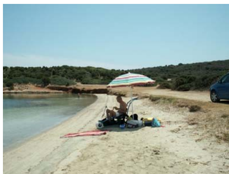
FOTO CAPO MALFATANO

Spiaggia di Capo Malfatano: a ca. 20 km dall'agriturismo in direzione Cagliari. Strada sterrata e terra battuta percorribile in auto. Ad un certo punto si trova una fune ed un cartello di divieto di accesso, ma le auto con contrassegno per disabili possono levare la fune e raggiungere dopo pochi metri sulla sinistra una spiaggia non tanto grande ma carina e comoda poiché si può lasciare l'auto a 5 metri dalla riva.