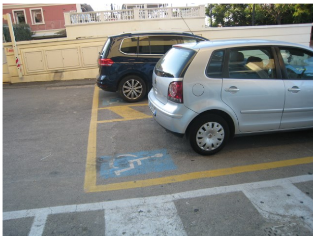
N.2 stalli angolo Via Fratti

Via Albereta (parallela di Via Roma): 2 parcheggi all'inizio della via, 3 parcheggi angolo ristorante Scalo del Granduca; Via Trieste : 1 parcheggi lato sx; Via Trento 9 : 1 parcheggio; Via Fiume : all'inizio 2 parcheggi; Piazza XXV aprile : 2 parcheggi; Piazza XXIV Maggio (mercato coperto) 1 parcheggio e 2 sul retro del mercato coperto (Via Petri). Viale Carducci- lungomare- 2 posteggi. Via Arno, Via Po' , 4 posteggi, viale Fratti, 2 posteggi.