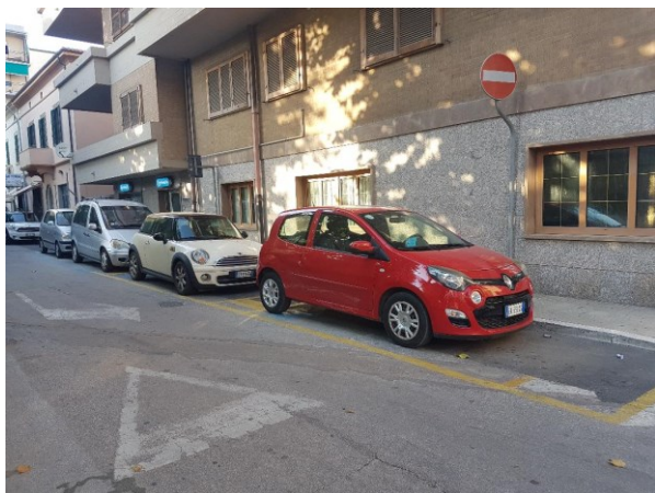
N.2 stalli dietro mercato coperto (via Petri)

Via Albereta (parallela di Via Roma): 2 parcheggi all'inizio della via, 3 parcheggi angolo ristorante Scalo del Granduca; Via Trieste : 1 parcheggi lato sx; Via Trento 9 : 1 parcheggio; Via Fiume : all'inizio 2 parcheggi; Piazza XXV aprile : 2 parcheggi; Piazza XXIV Maggio (mercato coperto) 1 parcheggio e 2 sul retro del mercato coperto (Via Petri). Viale Carducci 2 posteggi.