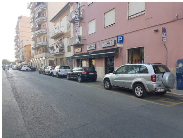
N.3 stalli via albereta, angolo ristorante Scalo del Granduca