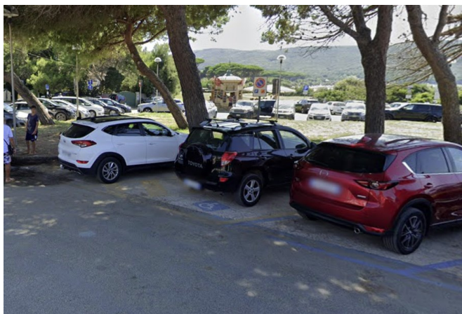
N. 2 stalli antistanti il locale

2 posti auto riservati ai portatori di disabilità, su fondo in asfalto, si trovano a 10 metri di fronte al Ristorante