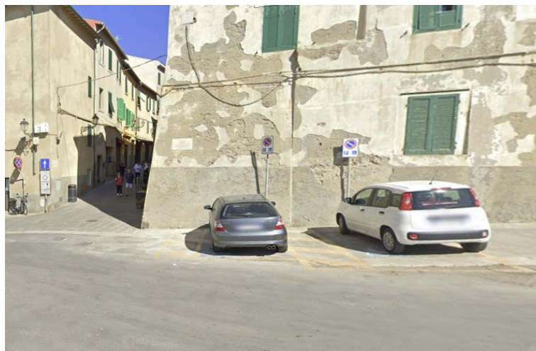
N. 2 stalli antistanti la piazza Bovio

2 posti auto riservati ai portatori di disabilità, su fondo in asfalto, si trovano a lato del corso principale Vittorio Emanuele II, a pochi metri da Piazza Bovio e a 50 metri dal Ristorante